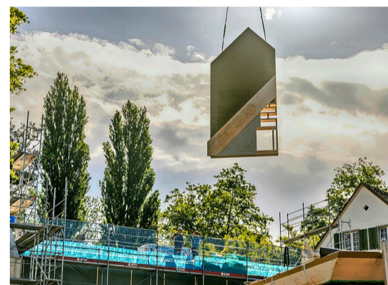
Präzise vorgefertigte Bauelemente wurden zur richtigen Zeit auf der Baustelle angeliefert.