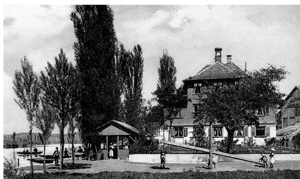
Kinder spielen vor dem damaligen Restaurant Kreuz, das im Besitz der Familie Beyerle war (ca. 1920).

zone 1974 kam auch das Restaurant in den Besitz von GF. Mehrfach wurde der Bau sorgfältig und umfassend renoviert, um die historische Substanz zu erhalten und den Besucherinnen und Besuchern einen attraktiven Ort der Einkehr und Gastlichkeit zu bieten – so in den Jahren 1974, 1990, 2008 und zuletzt 2024–2025. Rund 50 Jahre nach dem Kauf des «Kreuz» wird mit der Eröffnung des neu gebauten Hotels 1802 und des sorgfältig renovierten Restaurants 1802 ein neues Kapitel der langen Tradition von GF im Kloster-gut Paradies aufgeschlagen.