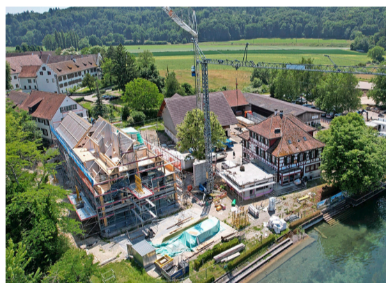
Die brandschutzrelevanten Teile des Hotels sind aus Beton, alles andere ist aus Holz.