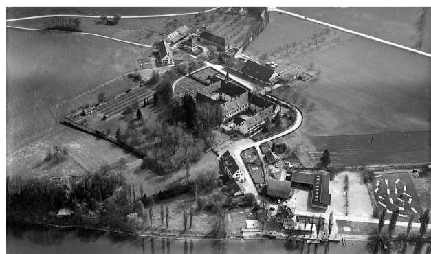
Diese Luftaufnahme aus dem Jahr 1972 zeigt das Klostergut Paradies von Norden.

Laubbaum- und Nadelholzarten. 1974 kaufte GF die Rheinuferzone, wodurch die Landfläche des Klosterbezirks von 50 auf 77 Hektaren wuchs. Im gleichen Jahr ging das GF-Ausbildungszentrum in Betrieb. Die neu gegründete Stiftung Paradies widmete sich fortan dem Unterhalt und Schutz dieses einmaligen Kultur-guts und setzt bis heute ein Zeichen für Bildung, Kultur und nachhaltige Gestaltung. Das Engagement von GF und den Stiftungen Paradies und Eisenbibliothek wurde 2004 mit dem Thurgauer Heimat-schutzpreis gewürdigt.